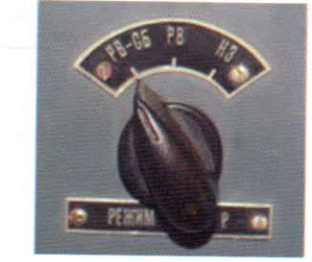
Прекидач избора прорисног ојсеја и преклојник за избор начина активирања бојеве главе ракете